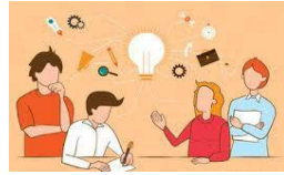
CURSOS FORMATIVOS 2024