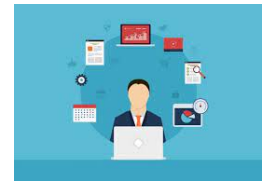
WEBINAR CLINICO 2024