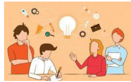
CURSOS FORMATIVOS 2024