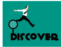
II SEMINARIO DE INVESTIGACIÓN PARA MIR/PIR/EIR